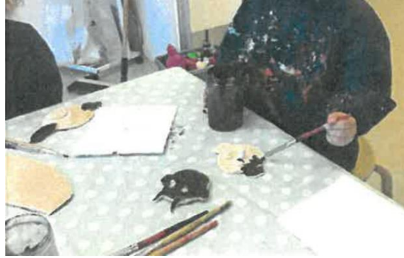
Figur 2 Eventyr som afsæt i børnehaven

I børnehaven valgte personalet at arbejde afsæt i eventyret om De Tre Bukkebruse, for at styrke en ny gruppedannelse. De arbejdede både i større og mindre børnegrupper. Her spillede de eventyret for hinanden, og rollerne gik på skift, så børnene fik afprøvet sig selv i forskellige roller og fik set hinanden i forskellige roller. De fremstillede eventyrets figurer i trylledej og legede efterfølgende med dem. Arbejdet med eventyret på forskellige måder, inspirerede børnene til selv at lege eventyret og til at bygge videre på historien. De arbejdede med forskellige følelser, sansninger, kropslige udtryk, små og store stemmer, vilde og rolige udtryk. De ventede på tur og øvede sig i at være i centrum og på at lytte og spille sammen.