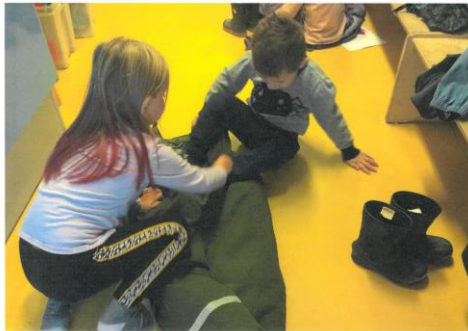
Figur 1 Hvordan er man en god ven?

Vi er optagede af den kvalitet vi tilbyder i hverdagspraksis, herunder af kulturen omkring vores måltider, måden vi er i garderoben på, samværet vi skaber når børn skal vaske hænder, skiftes, puttes, trøstes osv. Her et eksempel på et arbejde med kulturen børnene imellem: