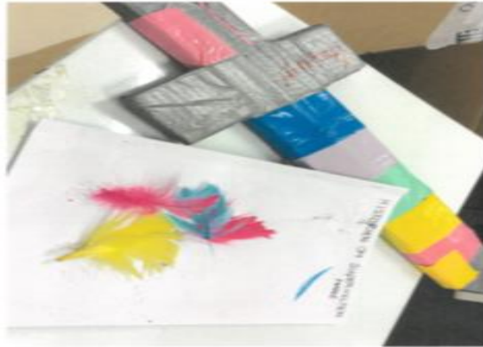
Figur 4 Afsæt i den enkelte, styrker det fælles i børnehaven

En gruppe i børnehaven har arbejdet med at skabe eventyr med barnet selv som helte-hovedrolle. Alle børn udarbejdede en bog, med beskrivelse af deres superkræfter og deres gerninger. Bogen blev udarbejdet i små børnegrupper med 2-3 børn af gangen. Barnet fortalte historien, den voksne skrev ned og barnet tegnede til. De lavede ligeledes masker og et sværd som byggede videre på deres historie og karakter. Processen satte fart på legene blandt børnene og nye fællesskaber opstod. Børn som ikke er sprogligt stærke, fik en stemme via bogen og fortalte med stolthed om deres superkræfter.