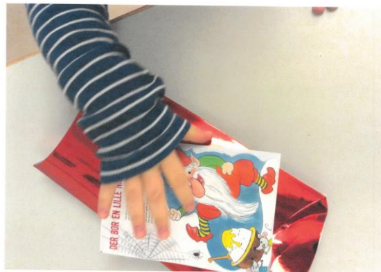
Figur 3 Julesange som afsæt for fællesskab i vuggestuen

I børnehaven valgte personalet at arbejde afsæt i eventyret om De Tre Bukkebruse, for at styrke en ny gruppedannelse. De arbejdede både i større og mindre børnegrupper. Her spillede de eventyret for hinanden, og rollerne gik på skift, så børnene fik afprøvet sig selv i forskellige roller og fik set hinanden i forskellige roller. De fremstillede eventyrets figurer i trylledej og legede efterfølgende med dem. Arbejdet med eventyret på forskellige måder, inspirerede børnene til selv at lege eventyret og til at bygge videre på historien. De arbejdede med forskellige følelser, sansninger, kropslige udtryk, små og store stemmer, vilde og rolige udtryk. De ventede på tur og øvede sig i at være i centrum og på at lytte og spille sammen.